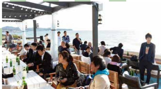
オープンし5ヶ月経っても変わらず賑わいを見せる淡路初店「GARB COSTA ORANGE」