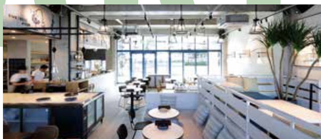
「Hi-NODE」1Fにオープンした「BESIDE SEASIDE」。 水辺の賑わいを創出する。

また、中心地の商業施設においては、8月にJR名古屋駅直結の商業施設「JRセントラルタワーズ タワーズプラザ レストラン街」においてココット料理と自家製ブリオッシュを提供する「BON COCOTTE」をオープン、9月には大丸心齋橋店本館7Fにおいてテラスを併設したレストラン&カフェ「TUFFE TERRACE EAT」、博多駅前通りに新たに誕生したハイグレードホテル「THE BLOSSOM HAKATA Premier」の朝食機能も補完する全135席のレストラン&グリル「Nine Doors」をオープンしました。